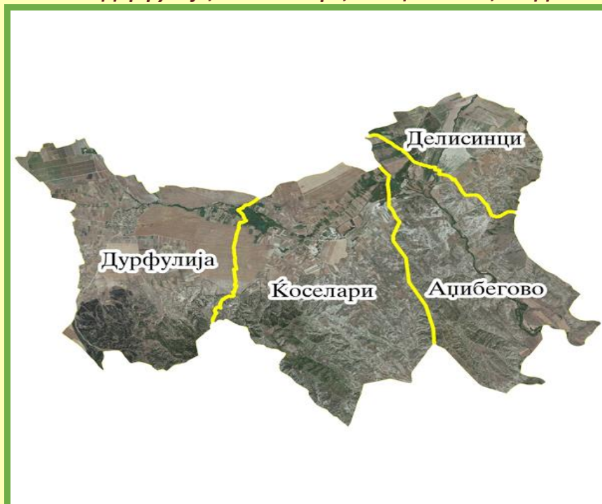
Слика 9 – КО Дорфулија, КО Ќоселери, КО Аџибегово, КО Делисинци