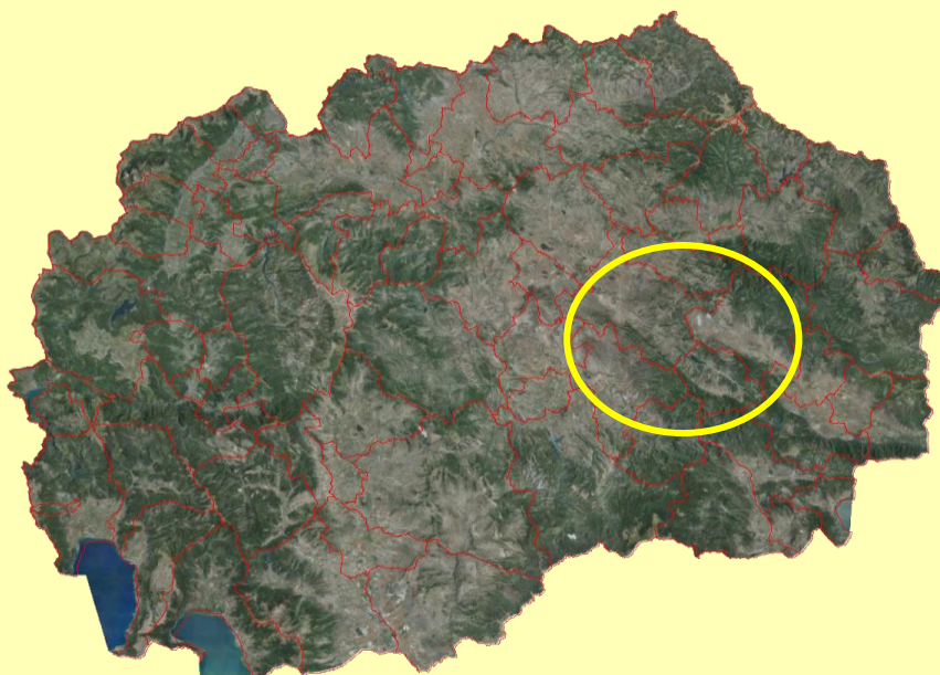
Слика 1 – Регион Свети Николе

Источниот регион се карактеризира со просечни температури во однос на северниот и јужниот дел од државата. Минималните просечни температури во текот на годината се движат од -13\text{ }^{\circ}\text{C} во зимскиот период до 13\text{ }^{\circ}\text{C} во летниот период, додека максималните просечни температури изнесуваат од 13\text{ }^{\circ}\text{C} во зимскиот период и до 40\text{ }^{\circ}\text{C} во летниот период. Во овој дел климатските услови се доста погодни за овоштарство.