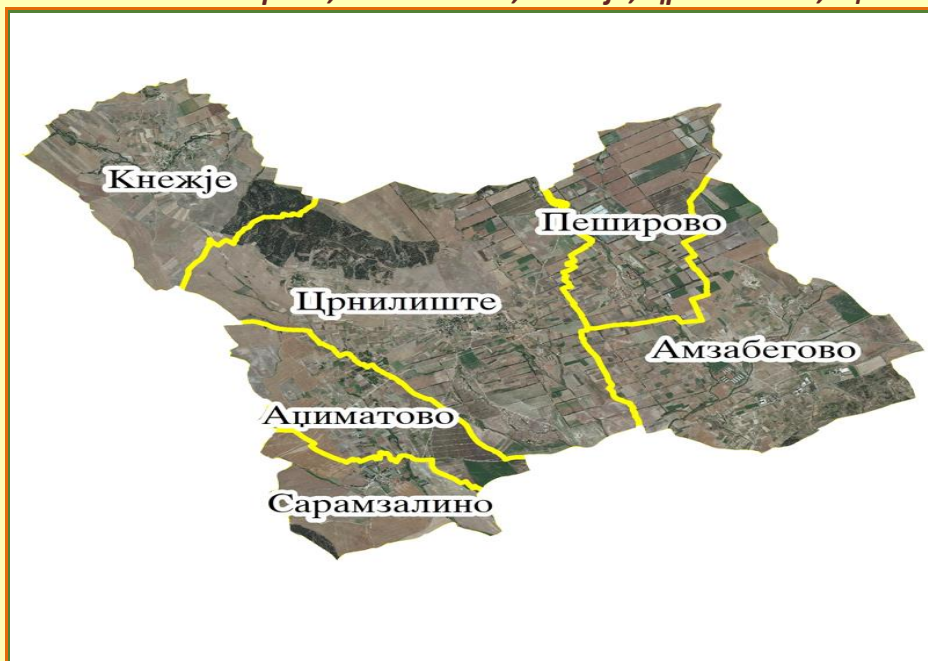
Слика 6 –КО Пеширово, Амзабегово, Кнежје, Црнилиште, Аџиматово, Сарамзалино